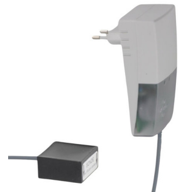
Ausführung mit 1 Sensor