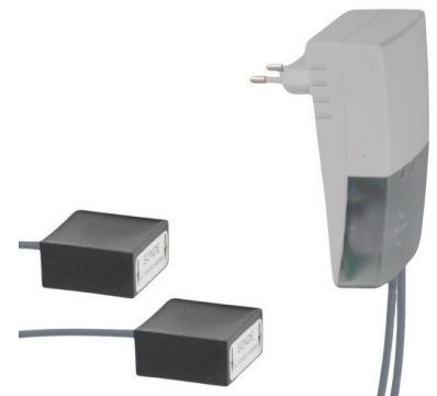
Ausführung mit 2 Sensoren